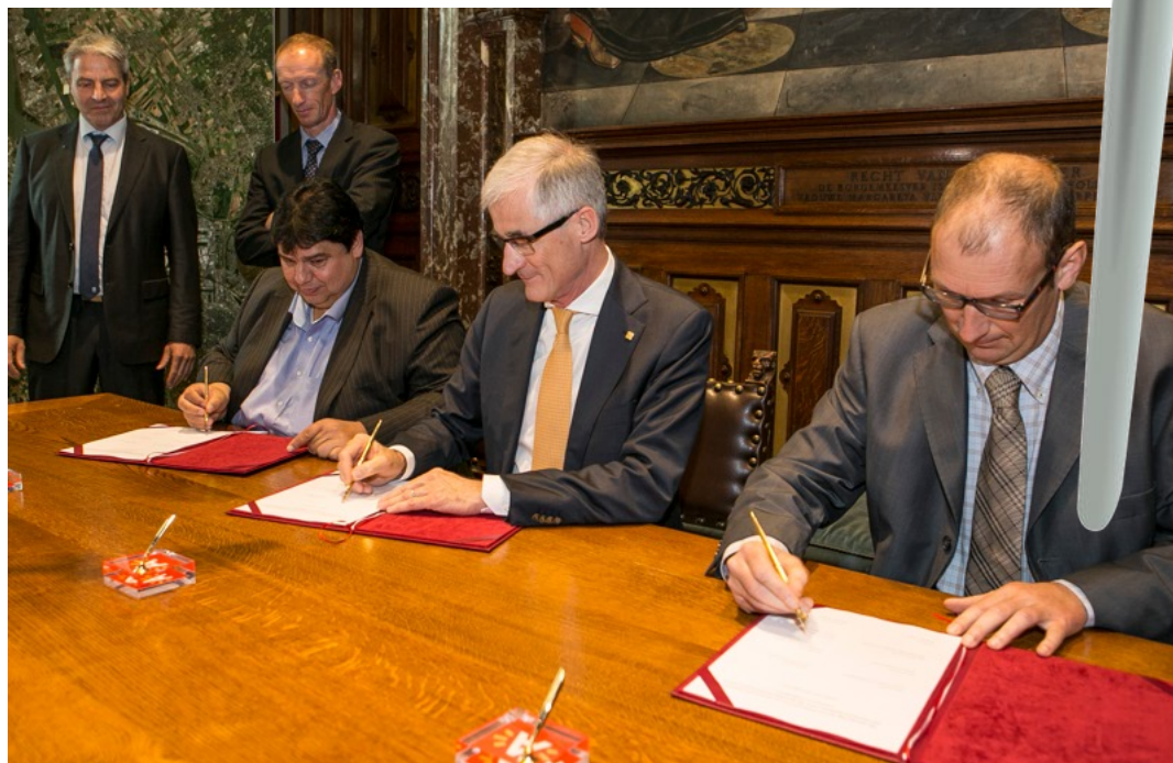
Geert Bourgeois (midden) geeft, samen met mensen van energiebedrijf Vleemo, het startschot voor de bouw van negentien windturbines in de Antwerpse haven.

Op dit moment halen ongeveer een half miljoen gezinnen hun energie uit windturbines. “Dat is mooi, maar we moeten beter kunnen. Volgens Europa kan in 2030 een op de vier Vlamingen gebruikmaken van hernieuwbare energie. Dat is een ambitieuze doelstelling, maar niet onmogelijk.